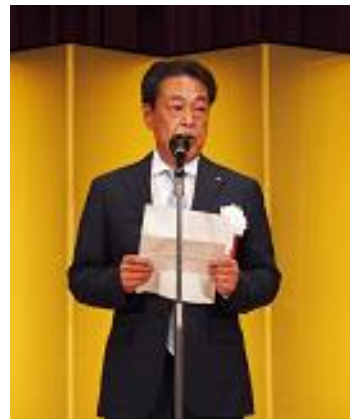
中西副会長閉宴御礼