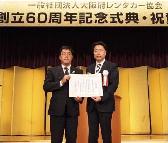
近畿運輸局長感謝状授与