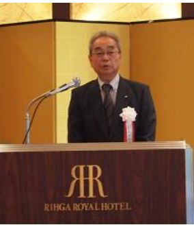
竹本副会長閉会挨拶