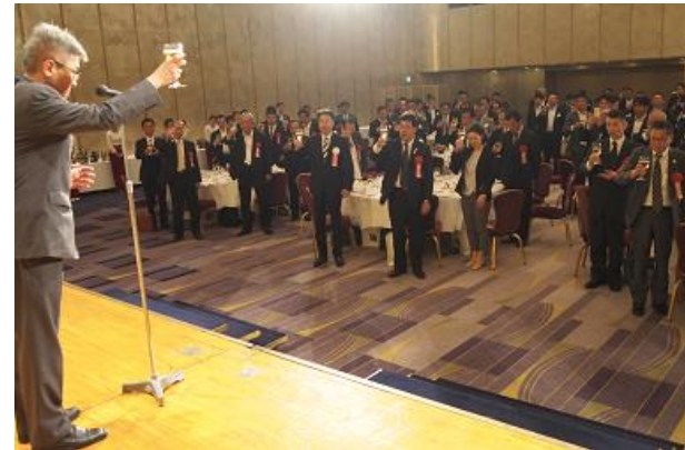
乾杯：福元大阪運輸支局長