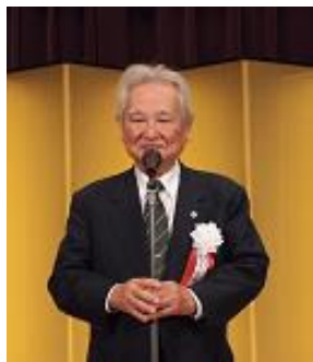
顧問：中馬元衆議院議員