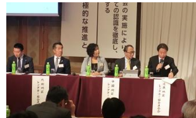
九州(大分)・中国(山口)・近畿(大阪)青年部会